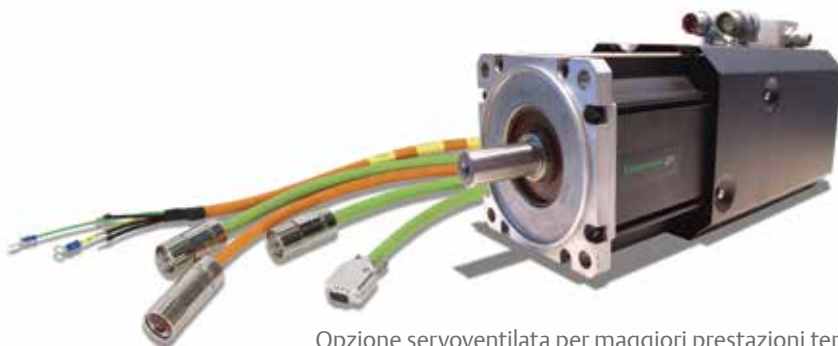
Opzione servoventilata per maggiori prestazioni termiche