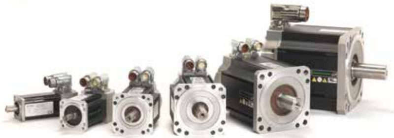
Le dimensioni della gamma Unimotor hd vanno da 55 mm a 190 mm

Unimotor hd vanta un alto rapporto potenza - peso, grazie al quale può essere facilmente integrato nelle applicazioni più piccole e gravose, quali la robotica industriale, il prelievo e posizionamento (Pick & Place) e l'imballaggio.